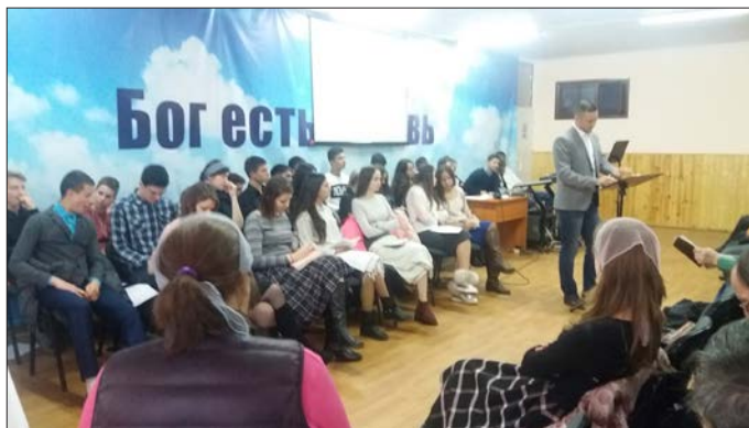
En hel grupp med ungdomar medverkade också i gudstjänsten som samlade många människor.

Vi ger dig denna information nu men kommer att återkomma med den vid fler tillfällen under våren. Vi vet att det innebär en del krångel, men de (organisationer och myndigheter) som inte följer dessa nya lagar, har mycket höga böter att vänta. Som organisation har vi inget val, annat än att följa denna nya lagstiftning. Vi hoppas att du har förståelse och kan hjälpa oss genomföra detta. Så fort vi har sammanställt vilken information som måste stå i brevet, kommer vi att skicka ut det till dig. Det är därför viktigt att du, när du får brevet, tar dig tid och läser, skriver under och sedan skickar in det i det medföljande svarskuvertet. Vi tackar på förhand för din hjälp!